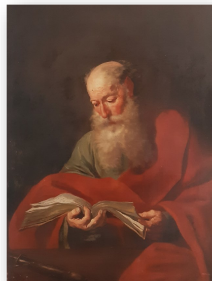
Saint Jérôme scrutant les Ecritures, peinture sur toile, Maison Saint-Julien

35 C'est ainsi que mon Père du ciel vous traitera, si chacun de vous ne pardonne pas à son frère du fond du cœur. »