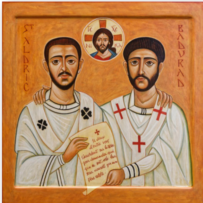
Ikône de la fraternité entre nos diocèses du Mans et de Paderborn avec St Aldric et Badurad, Chapelle Saint-Liboire de la Maison Saint-Julien

Pour en savoir plus : site internet http://www.lapierredangle.eu/