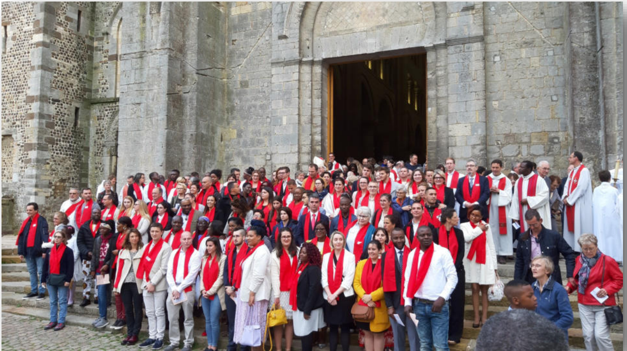
« Vous êtes le corps du Christ », confirmés de la Sarthe, Pentecôte 2019