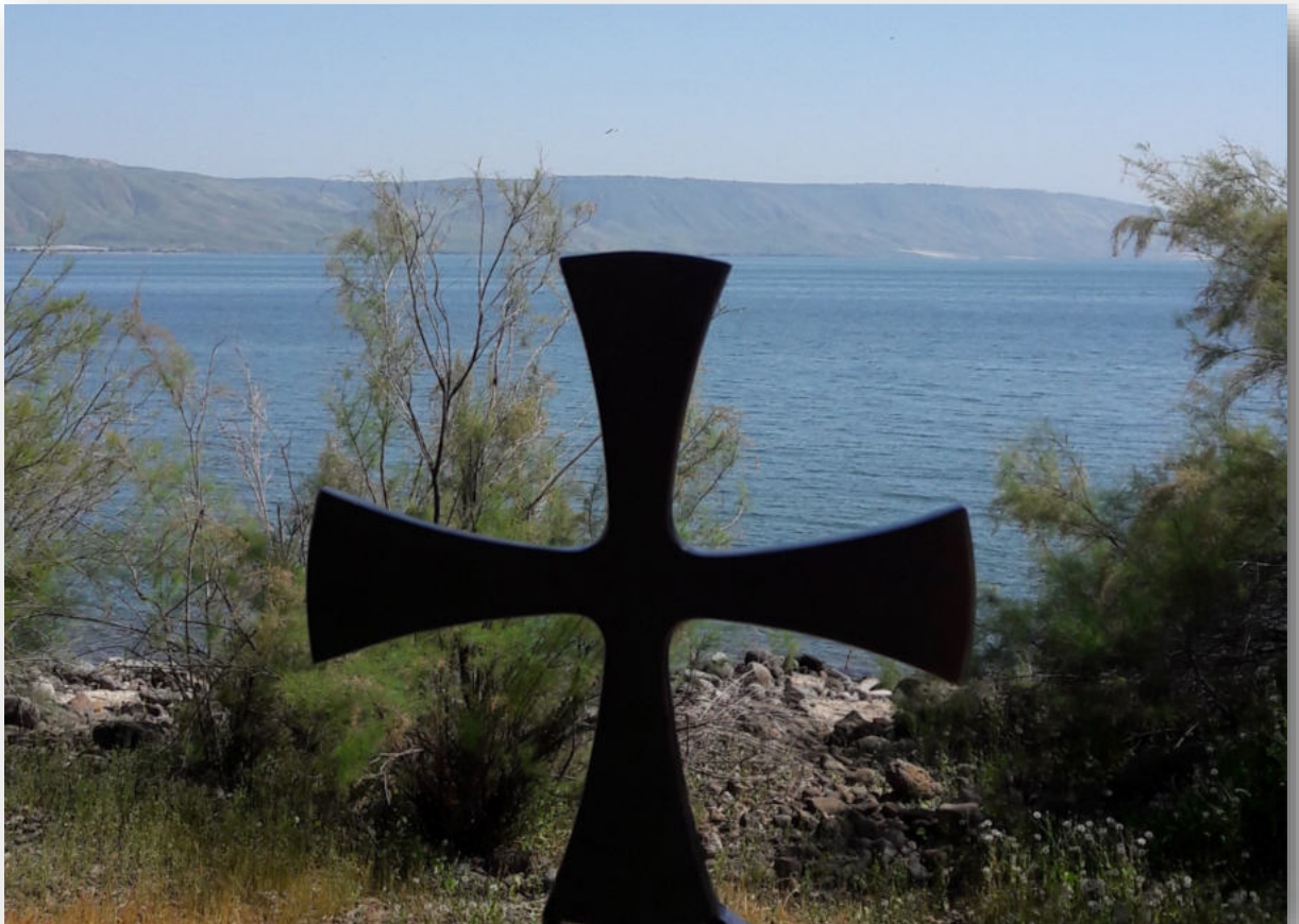
Bords du lac de Tibériade

08 c'est de vive voix que je lui parle, dans une vision claire et non pas en énigmes ; ce qu'il regarde, c'est la forme même du Seigneur. Pourquoi avez-vous osé critiquer mon serviteur Moïse ? »