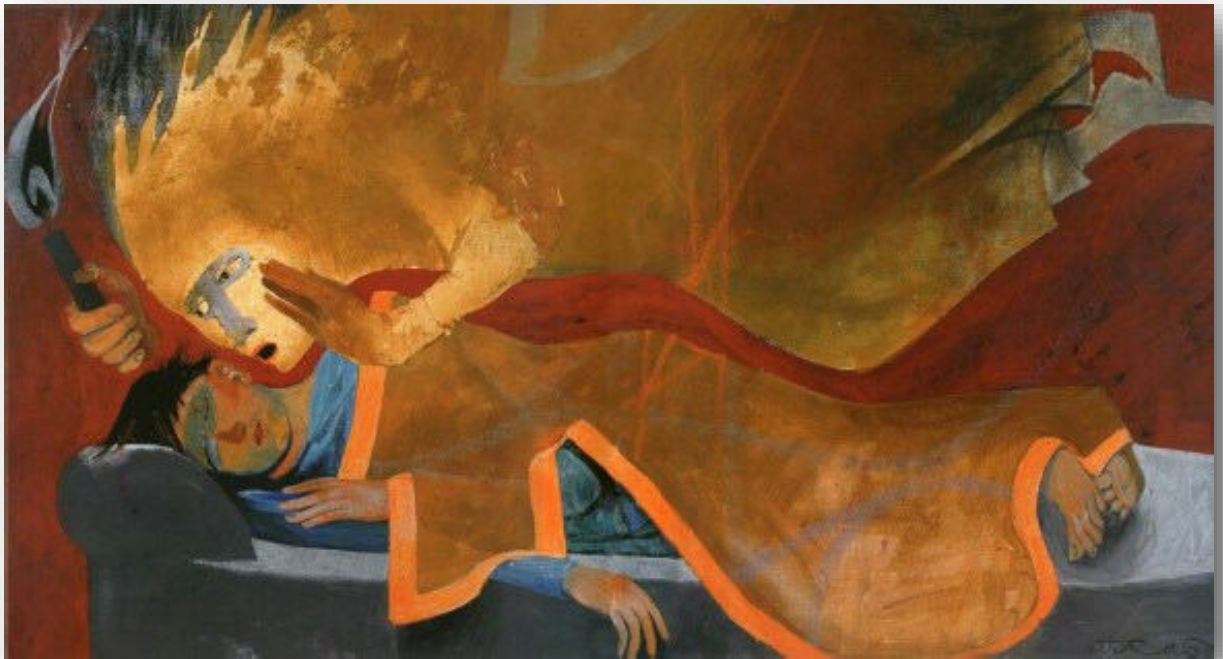
Songes de Saint Joseph, Arcabas

Mais maintenant ne vous affligez pas, et ne soyez pas tourmentés de m'avoir vendu, car c'est pour vous conserver la vie que Dieu m'a envoyé ici avant vous » (Gn 45, 4-5). Par la suite, Joseph explique comment sa présence en Egypte, consécutive à l'abandon de ses frères, a finalement permis à tous le clan d'éviter la famine. Le lecteur se trouve à ce moment-là, lui aussi, ébahi devant le génie de Dieu capable de faire advenir une issue positive au sein de la famille de Jacob gangrenée par la haine et la jalousie. Aux plans machiavéliques des frères de Joseph, projetant d'abord de le tuer puis de le vendre, Dieu répond par son propre dessein aboutissant à la réconciliation de toute la fratrie et à sa survie pendant ce temps hostile de famine. Dessein qui assume la haine des frères de Joseph mais la dépasse pour finalement la guérir. Cette issue, merveilleuse et inattendue, évoque immanquablement ce verset de Paul « Nous le savons, quand les hommes aiment Dieu, lui-même fait tout contribuer à leur bien, puisqu'ils sont appelés selon le dessein de son amour » (Rm 8, 28). Ou encore le psalmiste « Le Seigneur a déjoué les plans des nations » (Ps 32, 10).